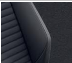
Комбинированная обивка сидений из искусственной замши/кожи черного цвета