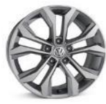
Легкосплавные колесные диски "Soho" 7J x 17 стандартно для Exclusive 2.0L