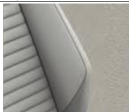
Комбинированная обивка сидений из искусственной замши/кожи светло-серого цвета