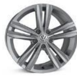
Легкосплавные колесные диски "Sebring" 7J x 17