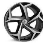
Легкосплавные колесные диски "Bonneville" 8J x 18